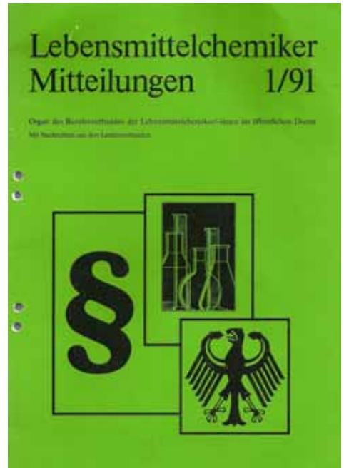
Titelblatt der Lebensmittelchemiker-Mitteilungen 1/1991