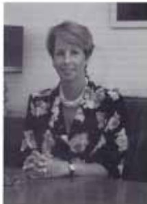
„Fachministerische Staatssekretärin im Bundesministerium für Gesundheit: Dr. Bergmann-Pohl“

Alle diese Probleme sind in einem Liste Angelegenheiten, die im Zuständigkeitsbereich der Bundeskanzlerin liegen. Der BLC könnte jedoch deutlich machen, daß der Bund in die Verantwortung für die Durchführung „einer“ Lebensmittel- und Berufsaufsichtsgesetzgebung nicht und im übrigen auch gegenüber der EU für den Vollzug der Thoma-Bericht nicht verantwortlich ist. Es würde vorteilhaft, daß man weiterhin in Kontakt bleiben würde, um aktuell Probleme zu besprechen. Die Staatssekretärin sagte zu, dem BLC bei der nächsten Möglichkeit vorzulegen, wie ein Kontakt zur Verfügung zu stehen.