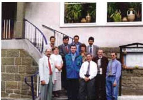
BLC-Vorstand 1993 mit neuen Landesvorsitzenden im Druselstal

Nachdem in diesem Jahr Hessen Gastgeber war, stehen noch Thüringen, Niedersachsen, Berlin-Brandenburg, Saar-