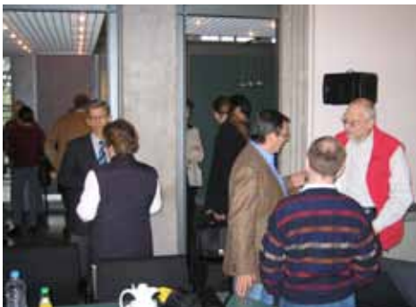
Diskussionen, Braunschweig 2004