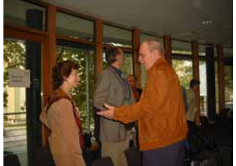
Diskussionen, Erlangen 2006